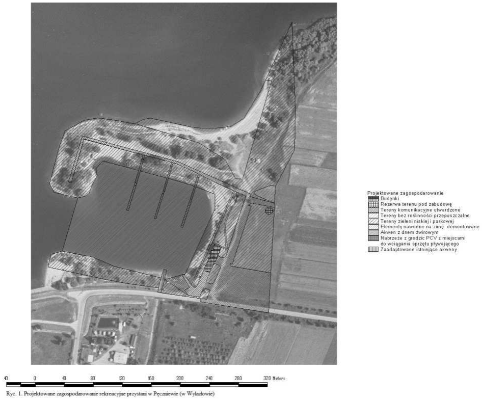
Ryc. 1 -Projektowane zagospodarowanie rekreacyjne przystani w Pęcznie wie ( Wylądowie)